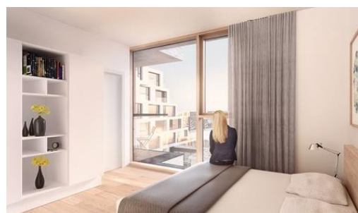
Billeder fra renderinger af udvalgte lejligheder i byggeriet